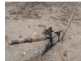
Arada amb pales