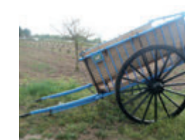
Carro de barana