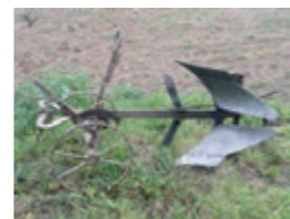
Arada amb rodes