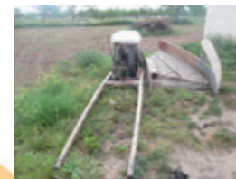
Màquina de segar