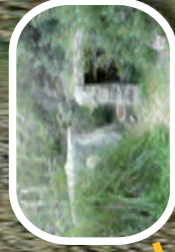
POUETS DE CAN CAIMA