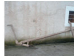
Arada de parell d'animals amb jou