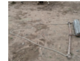
Carretó de batre