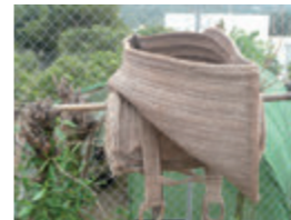
Sarri i albarda